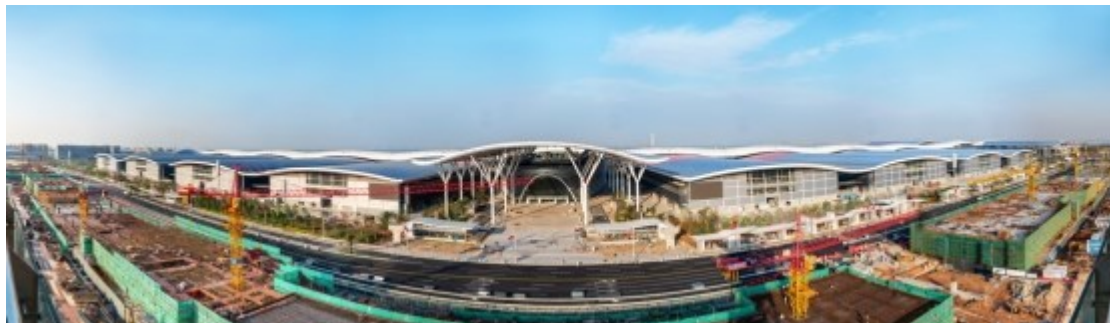
深圳国际会展中心实景图

由于与机场毗邻，令“新会展中心”拥有了独特的对外展示面，自北向南降落至深圳机场的航线，刚好飞越会展中心的屋顶，空中俯瞰，屋面如起伏的波浪，中央廊道则宛若巨龙出海般南北延伸，磅礴恢弘的建筑气势一览无余。