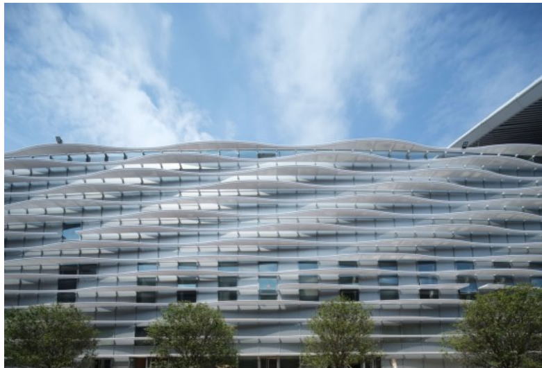
登录大厅立面实景图

“新会展中心”的造型设计意向提取深圳主要元素，如山海花城、文化艺术、科技创新等，设计团队尝试过云海、丝带、花瓣等多种元素，经过多次讨论最终确定以海浪为原型，采用蓝色层顶，屋面颜色提取了深圳市花簕杜鹃的紫色渐变到海天的蓝色，呈现彩色丝带花纹，寓意“海上丝绸之路”。